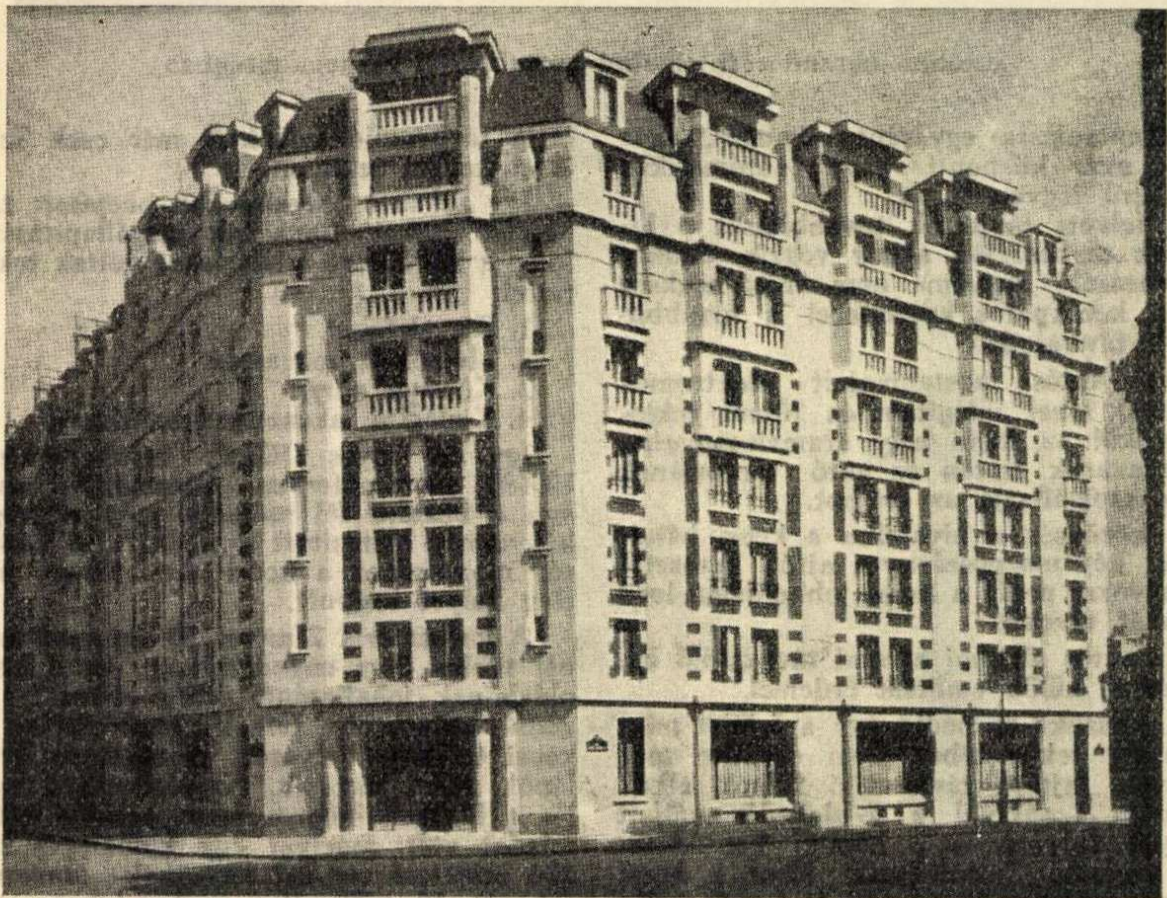
A francia posta nőtisztviselőinek új otthona.