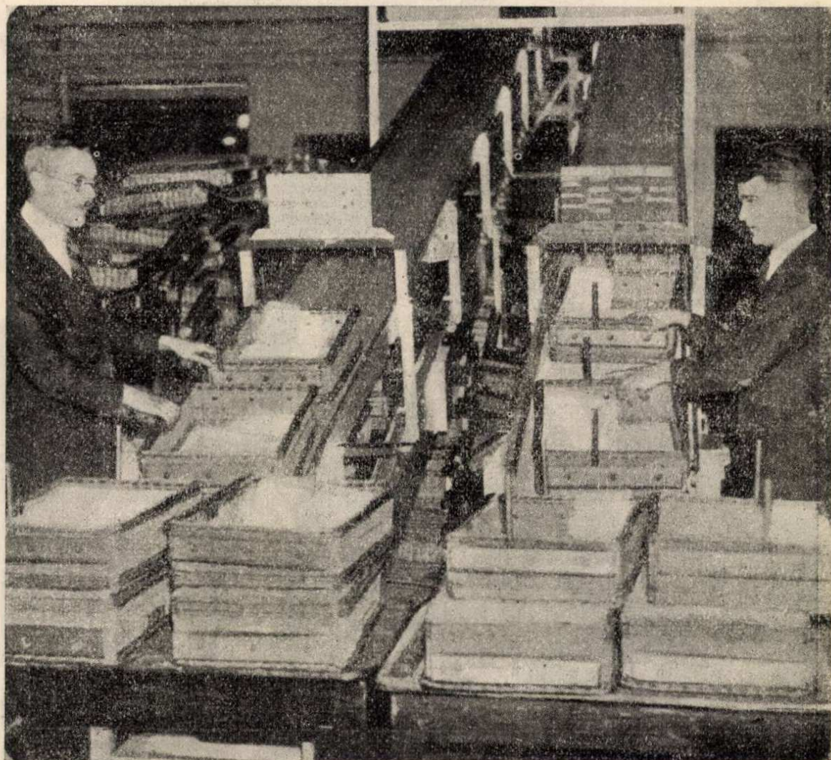
1. ábra. Mount Pleasant postahivatal levélszétosztó berendezése. A berendezés a szétosztott leveleket rendeltetési hely szerint kosorakba gyűjti.

A gépezet hetenként 24.000.000 levélnek rendeltetési hely szerinti szétosztását végzi el, oly módon, hogy a kezelő a mozgó szalagon hozzáérkező leveleken olvasható címek szerint — egy nagyméretű írógépszerű billentyűzeten — megnyomja a megfelelő (pl. „Glasgow“, „Dublin“ stb.) feliratú gombokat, mire az egyes levelek automati-