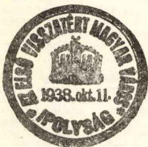
2. sz. ábra. Ipolysági alkalmi bélyegző lenyomata.

Különleges színű bélyegzőlenyomatot — bár a bélyeggyűjtők egyesülete ilyen irányú kívánságát előterjesztette, engedély hiányában a felszabadult Ipolyság hivatala sem használhatott. A felszabadulásra tervbe vett különbélyegző a felszabadulás napjára nem, csak az azt követő napra készült el. (2. ábra.)