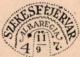
Székesfehérvár évszámos bélyegzőlenyomata 1847. évből.*

meg útját. Ugyancsak a bécsi múzeumban őrzött s 1781. évből származó már említett rendelet érkezési bélyegzőről tesz említést. Ez a rendelet