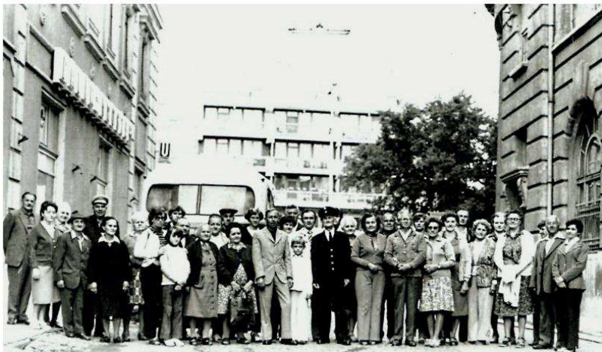
34. kép. Aktív és nyugdíjas dolgozók kirándulni indulnak. A balról álló épület helyén állt Omaszta Gusztáv postamester háza, jobbról a postapalota, szemközt pedig az akkor épülő új hivatal látható. (1977.)