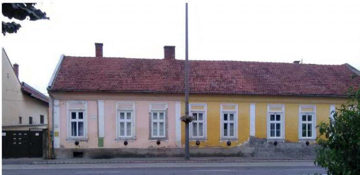
38. kép. Az egykori MEHIV-nek helyet adó épület. A bal oldali első három ablakhoz kapcsolódó helyiség állt a posta rendelkezésére. A Munkácsy Mihályt 1852-ben örökbe fogadó nagybátyjának, Reök Istvánnak ugyanez az épület volt az első csabai lakása. Innen sétált el Miskával naponta a Steiner-kúriába. (2017. Ogrincs Pálné fotója.)