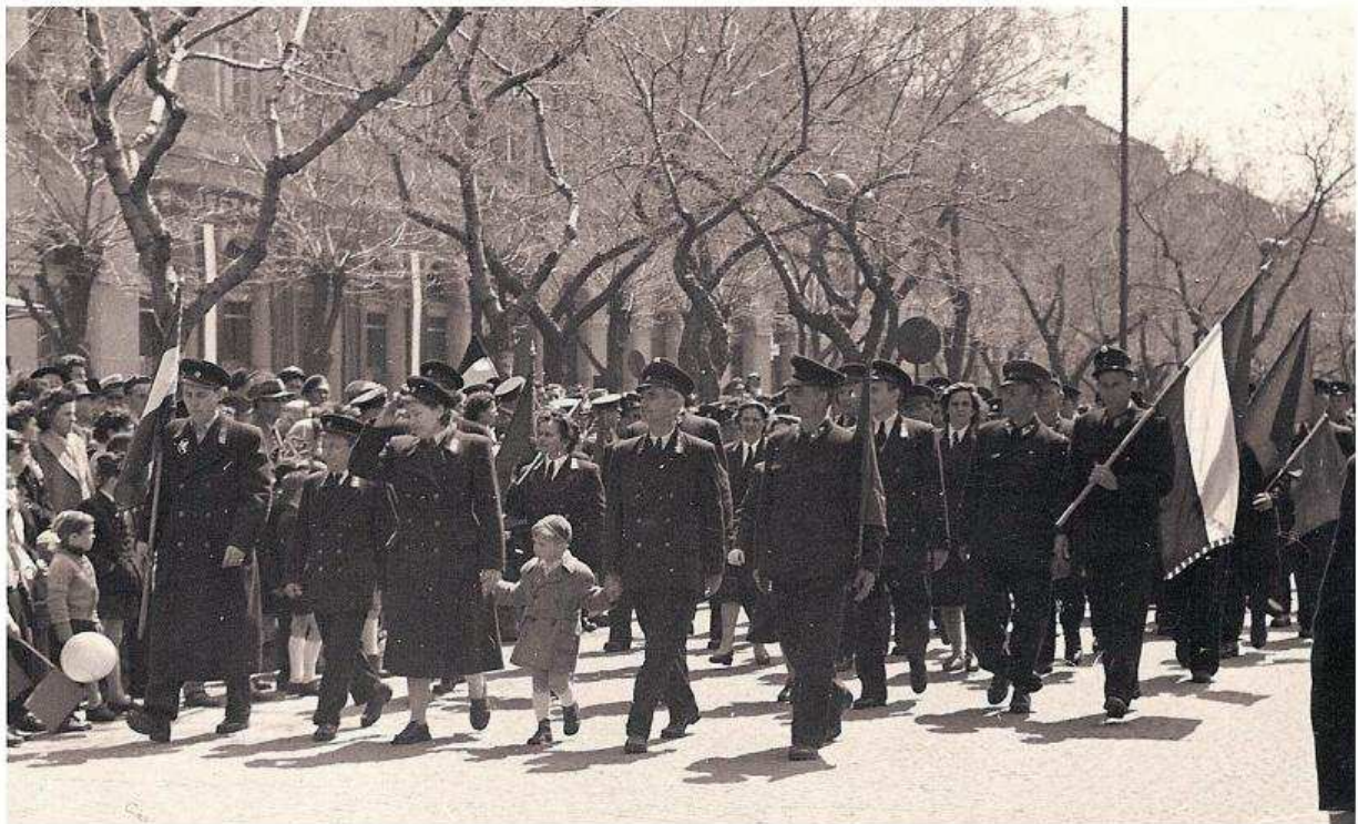
10. kép. Postás dolgozók május 1-jei felvonuláson. (1950-es évek.)