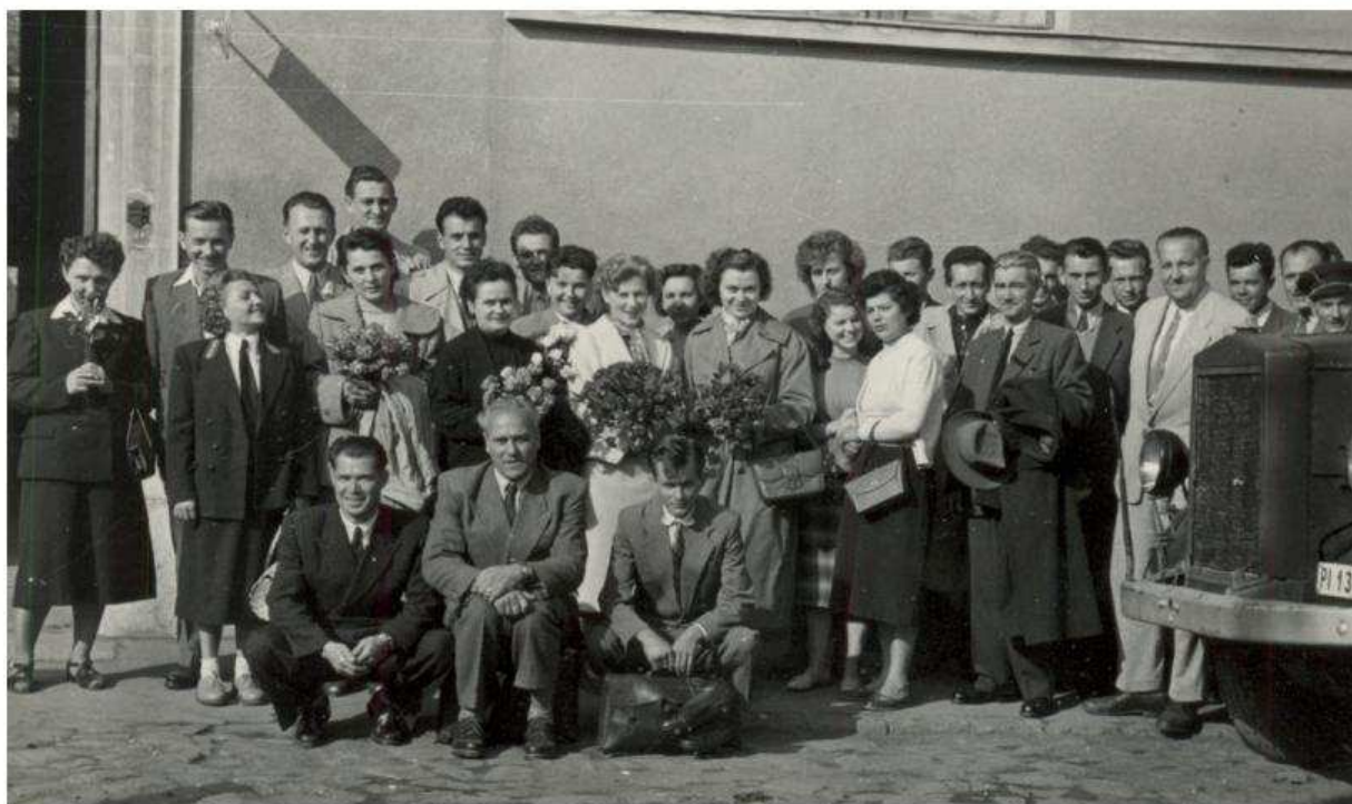
8. kép. Postás dolgozók kirándulásra készülődnek. (1950-es évek.)