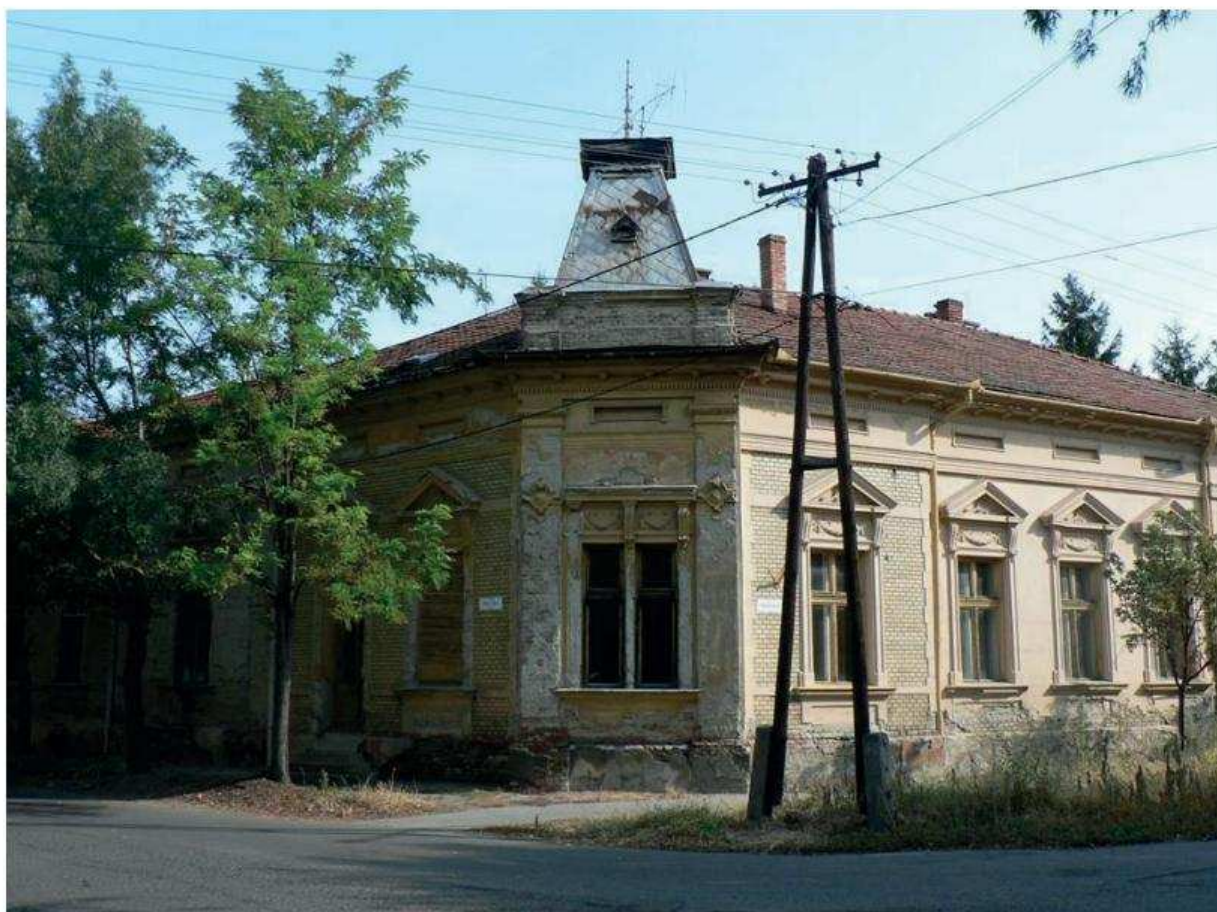
39. kép. Békéscsabai Távközlési Üzem egykori épülete a Szarvasi út 7. sz. alatt. (2016. Gellért Mária fotója.)