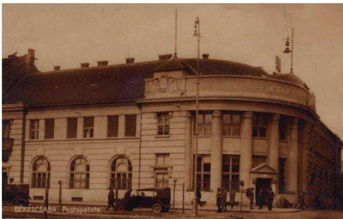
1. kép. A postapalota Szent István tér felőli homlokzata az átadást követően, civil járókelőkkel. (Képeslap, 1927. Tuska János József magángyűjteményéből.)